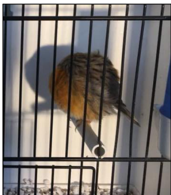
Рисунок 3 Попугаи спят

Днём попугай много ест и пьёт, а вечером и ночью спит. Когда попугай спит, то он принимает форму шара 3 (рисунок 3).