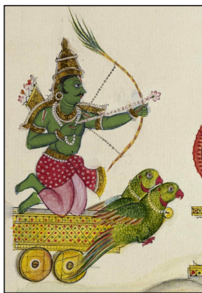
Рисунок 4 Попугаи на индийской гравюре

В Париже попугая можно купить в зоомагазине 5 около Нового Моста и на Сите. В зоомагазине есть собаки и коты, но ручных попугаев там нет. Ручного попугая можно купить только на Сите.