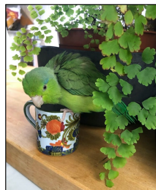
Рисунок 2 Домашний ручной попугай

А е́сли он ди́кий, то ему́ нужны́ други́е попугáи, он не мо́жет жить оди́н, то́лько у люде́й.