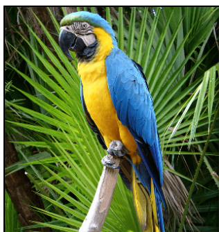
Рисунок 1 попугай Ара

Сейча́с существу́ет 398 ви́дов попугáев. Они́ живу́т в Азии, Индии, Африке, Южной и Центра́льной Аме́рике, но бо́льше всего́ попугáев живу́т в Австра́лии. Попугáи лю́бят тёплый кли́мат (тро́пики и субтро́пики) и тропи́ческий лес.