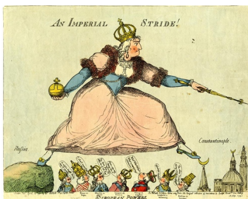
Английская карикатура, конец XVIII века